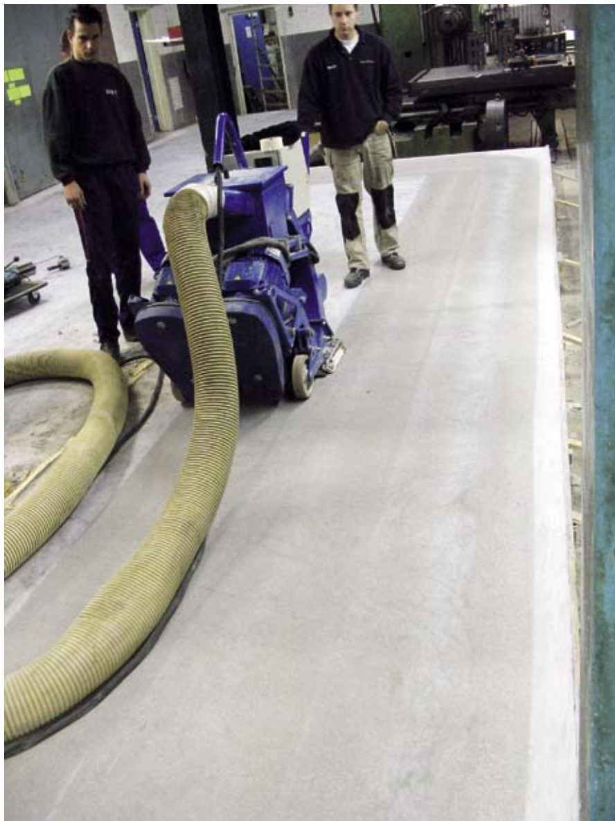
Stralen van het beton.