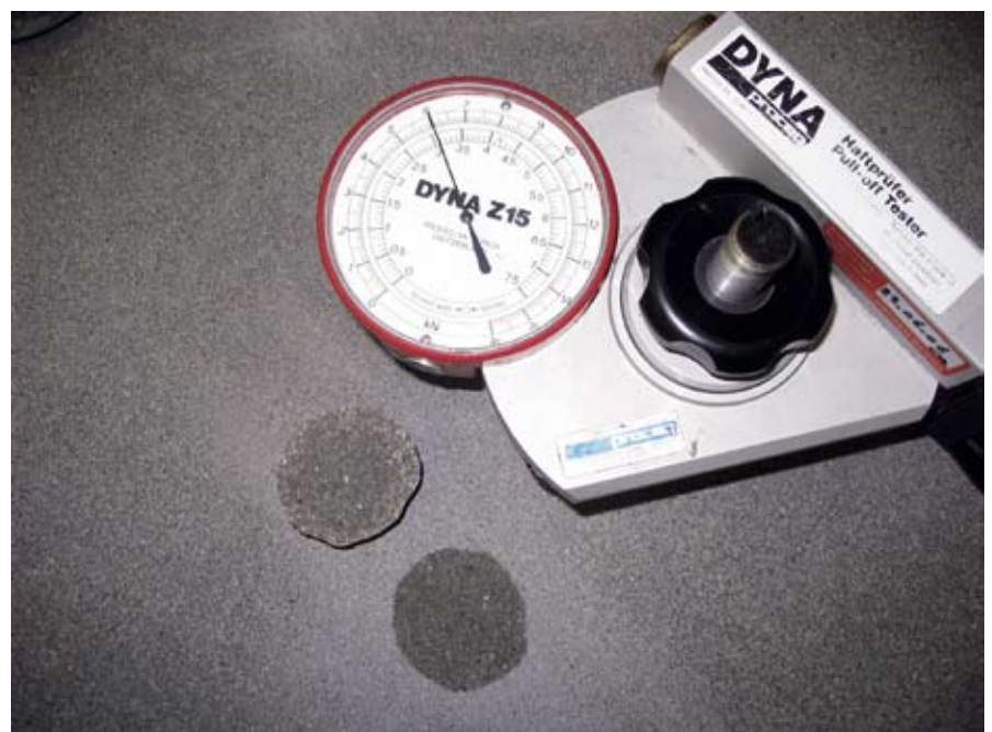
In alle fasen werd een huidstreksterkte gevonden die groter was dan 2,5 MPa.

aan dit mengsel ook vliegias toegevoegd. Uit een groot aantal onderzoeken van ABT blijkt dat het uitdrooggedrag van beton sterk positief wordt beïnvloed door toevoeging van vliegias aan het mengsel. Figuur 2 geeft een theoretische benadering van de sterkteontwikkeling. De stippellijn geeft de toegevoegde sterkte door vliegias weer. In principe begint vliegias meestal pas na een dag of twintig structureel bij te dragen aan de sterkte ontwikkeling. Uit de figuur blijkt dat na twee dagen verharding een sterkte van ongeveer 25 MPa wordt gehaald. Op basis van deze benadering, de opgedane ervaringen uit het verleden en enkele laboratoriumproeven, werd het definitieve mengsel gekozen.